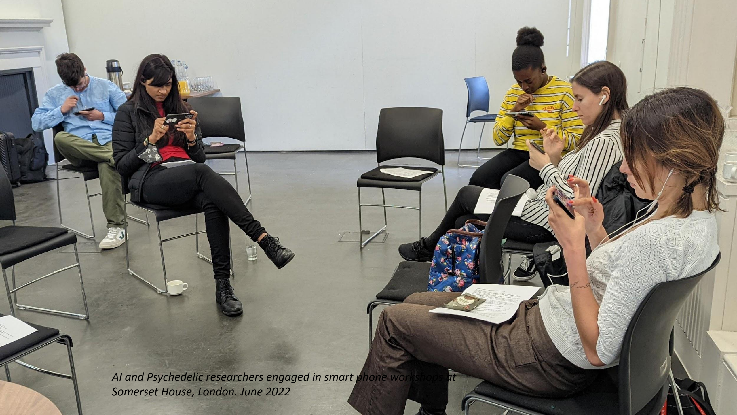
AI and Psychedelic researchers engaged in smart phone workshops at Somerset House, London. June 2022